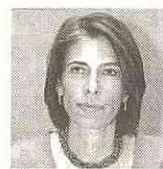
ROSARIO CÓRDOBA PRESIDENTE DEL CONSEJO PRIVADO DE COMPETITIVIDAD

SÍGANOS EN: www.larepublica.co Con el reporte de Doing Business de 2011 donde se estudia el clima de negocios.